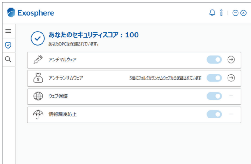
エージェントメイン画面