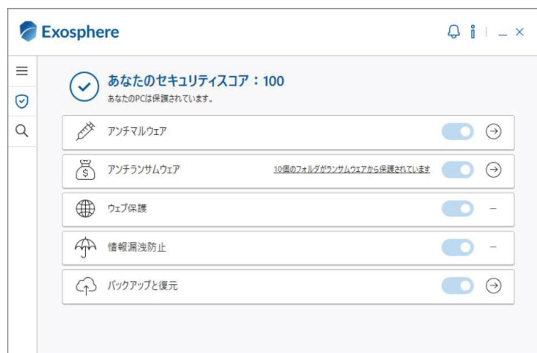
エージェントメイン画面